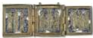
31 ICONA DA VIAGGIO IN BRONZO, RUSSIA XIX SECOLO con ante a smalti con bassorilievi devozionali. Misure aperta cm. 6,5 x 17.