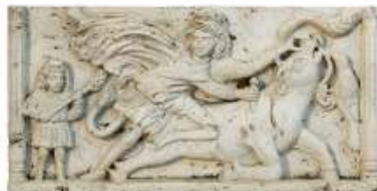
11 ALTORILIEVO IN POLVERE DI MARMO E STUCCO, INIZIO XX SECOLO raffigurante Mitra Tauroctono. Misure cm. 42 x 81 x 9.

Condition report Mancanze alle dita, sbeccature