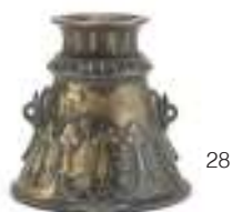
28 PICCOLO MORTAIO IN BRONZO DORATO, PROBABILMENTE FIRENZE XVII SECOLO con corpo decorato in rilievo a motivi di palmette dorate e racemi di campanule. Base rudentata. Misure cm. 10 x 10.