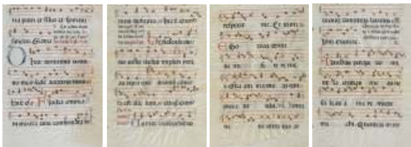
142 (quattro di sei)

142 SEI PAGINE MINIATE, XVII SECOLO a rigo musicale su carta pergamena. In sei cornici a giorno. Misure cm. 44 x 31 ca. Difetti, mancanze e gore. M.O.