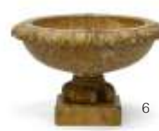
6 VASCA IN ALABASTRO, XIX SECOLO con bordo baccellato e piede mobile. Misure cm. 20 x 30 ca. Mancanza alla base.