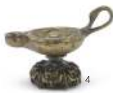
4 LUCERNA IN BRONZO, STILE ARCHEOLOGICO, INIZI XX SECOLO a patina dorata, con vasca decorata in altorilievo. Manico a collo di cigno, base fogliata. Misure cm. 12 x 9 x 15.