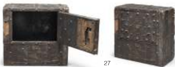
27 FORZIERE IN FERRO BATTUTO, XVII SECOLO con fusto ligneo. Uno sportello sul fronte, corpo interamente borchiato. Misure cm. 60 x 64 x 30. Mancanze alla parte destra ed ad un angolo superiore. Serratura e chiave mancante, difetti.