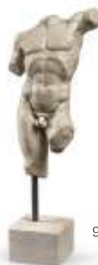
9 SCULTURA DI STILE ROMANO, INIZI XX SECOLO in polvere di marmo e gesso, raffigurante il torso di Apollo. Basetta in travertino. Misure cm. 42 x 22 x 14.