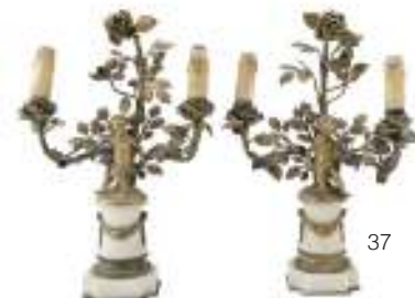
37 COPPIA DI PICCOLI CANDELABRI IN BRONZO, INIZI XIX SECOLO a due braccia con decori a ramages fogliate e fiorite, centrate da figura di amorino allegorico. Base a colonna in marmo bianco con finitura a ghirlanda floreale. Misure cm. 36 x 26 x 14. Ossidazioni.