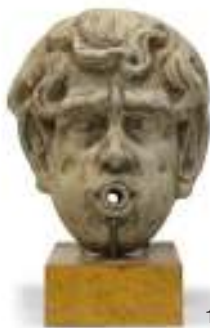
1 BOCCA DI FONTANA IN TERRACOTTA, INIZIO XX SECOLO con resti di lacca e base rettangolare in acero. Misure scultura cm. 40 x 33 x 13. Difetti.

Le stime indicate con la sigla M.O. si intendono al miglior offerente.