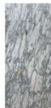
10 PIANO IN MARMO BIANCO E NERO D'ACQUITANIA, XVIII SECOLO a sezione rettangolare. Misure cm. 150 x 68.