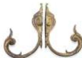
32 COPPIA DI REGGI TENDA IN BRONZO, XVIII SECOLO con braccio a ramages con foglie e riccioli. Misure cm. 18 x 5 x 13.