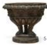
5 VASO IN TERRACOTTA, XIX SECOLO a lacca marrone, di gusto classico, con bordo a palmette piedi a trapezofori con base a mensola. Misure cm. 27 x 30. Mancanze.