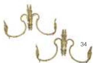
34 DUE COPPIE DI REGGITENDA, FINE XVIII SECOLO in bronzo dorato, con braccia curvate e finali a motivi vegetali. Misure cm. 25 x 21 x 7.