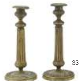
33 COPPIA DI CANDELIERI IN METALLO DORATO, XIX SECOLO di gusto Luigi XVI, con fusto rudentato e piede a foglie. Misure cm. 24 x 10,5. Difetti.