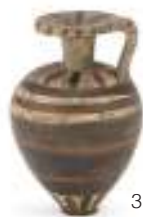
3 ARYBALLOS ETRUSCO CORINZIO, XX SECOLO in terracotta.