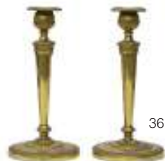
36 COPPIA DI CANDELIERI IN BRONZO DORATO, INIZI XIX SECOLO con fusto conico poligonale con piedi ferini. Piede circolare godronato a palmette. Misure cm. 27 x 13.