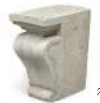
2 CAPITELLO IN MARMO BIANCO, XVIII SECOLO a mensola scolpito a voluta baccellata. Misure cm. 40 x 30 x 22. Mancanze.