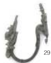
29 REGGITENDA IN BRONZO, FINE XVIII SECOLO a patina verde, con finale a panoplie militari. Misure cm. 25 x 8 x 17.