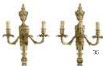
35 COPPIA DI APPLIQUES IN BRONZO DORATO, INIZI XIX SECOLO con montante sagomato a drappaggi, foglie, nastri e perlatura. Tre braccia a ramages, con boccagli incisi a foglie di alloro. Misure cm. 47 x 33 x 23.