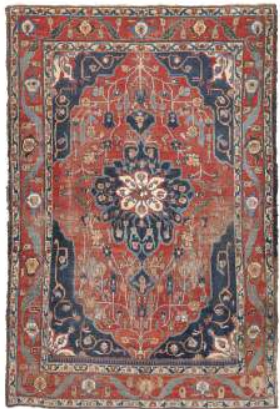
220 RARO TAPPETO FEHERAGAN, INIZIO XX SECOLO con grande medaglione in blu e motivi secondari a tralci con palmette, herati e tulipani, nel campo centrale a fondo rosso. Misure cm. 340 x 225. Abraches e un piccolo strappo nel campo centrale.