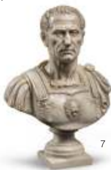
7 SCULTURA DEL BUSTO DI CESARE, INIZI XX SECOLO da modello classico, in polvere di marmo e gesso. Base con zoccolo quadrato. Misure cm. 38 x 24 x 15.