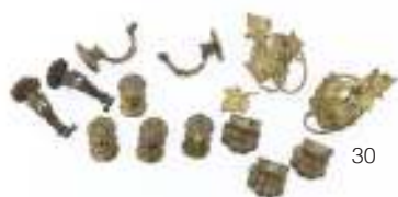
30 TREDICI FINITURE IN BRONZO DORATO, XIX SECOLO a patina dorata. Il lotto è composto da tre coppie di appendiabiti di varie fogge, tre piedi ferini e quattro appendiabiti a becco di grifone. Misure piedi ferini cm. 4,5 x 8 x 7. Difetti, una foglia mancante ed una staccata di due appendiabiti.