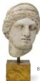
8 TESTA DI DIANA IN STUCCO, INIZI XX SECOLO da modello classico. Basetta in legno laccato a finto marmo giallo. Misure cm. 26 x 20 x 25 ca.