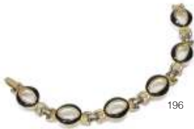
196 GRAZIOSO BRACCIALE, ANNI '90 in metallo dorato, a maglia snodata con elementi ovali smaltati. Lunghezza cm. 19,5.