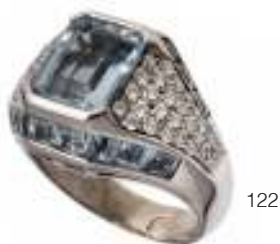
122 ANELLO in oro bianco 18 kt., a cupola con acquamarina centrale a taglio rettangolare e pavè di brillanti laterali. Brillanti ct. 0.80, ca, peso complessivo gr. 13,30. € 1200-1800