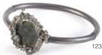
123 BRACCIALE RIGIDO in metallo argentato con cornice centrale sbalzata e moneta antica centrale. Diametro cm. 6,5 M.O.