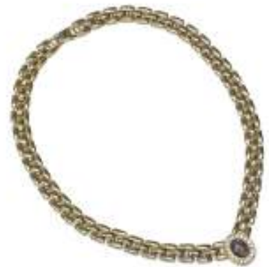
202 COLLANA ANNI '90 in metallo dorato, con ovale centrale decorato da pietra sintetica cabochon contornato da strass. Lunghezza cm. 40,5.