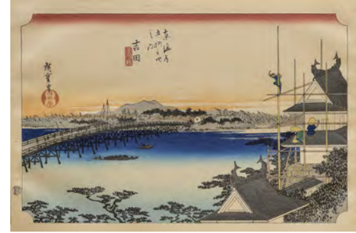
53 (quattro di cinquantatre)

53 UTAGAWA HIROSHIGE (Edo, Giappone 1797 - 1858)