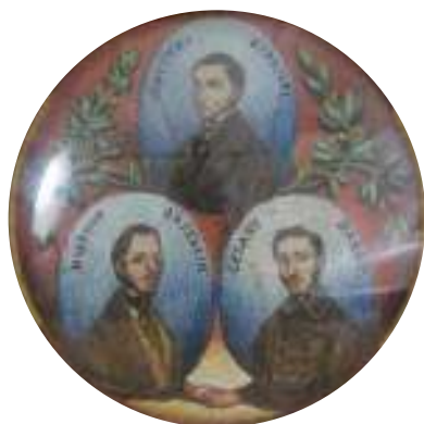
357 PITTORE ITALIANO, XIX SECOLO

MINIATURE DI PAPA E REGNANTI RITRATTI DI BALBO, D'AZEGLIO E GIOBERTI Coppia di miniature circolari su cartone diametro cm. 7