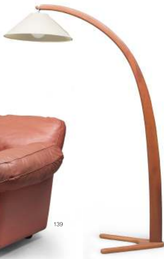
140 LAMPADA AD ARCO IN FAGGIO, ANNI '70 con fusto piatto curvato. Piedi a forcina e paralume in pergamena a pagoda. Misure cm. 192 x 63 x 52. Difetto al paralume.