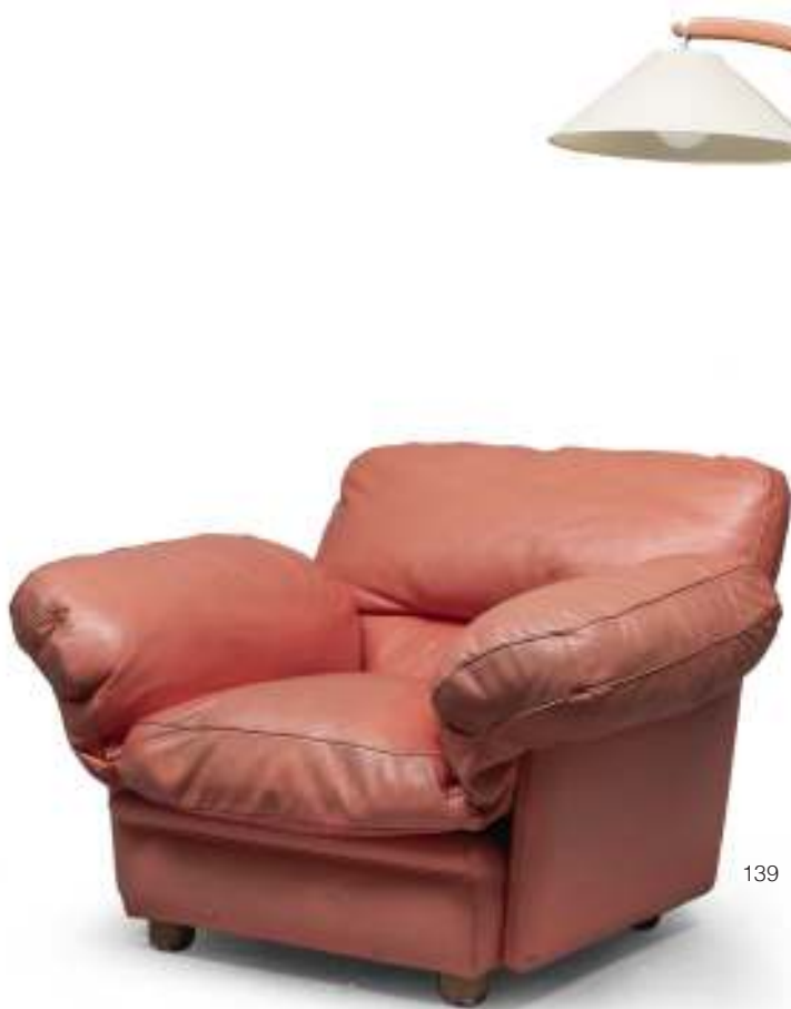
139 POLTRONA DI TITO AGNOLI PER FRAU, MODELLO POPPY ANNI '60/'70 con cuscini imbottiti e rivestiti in pelle. Misure cm. 70 x 110 x 110