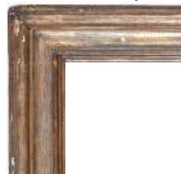
95 (dettaglio cornice)

Cornice modanata in legno dorato, del XVII secolo (alcune piccole cadute di doratura)