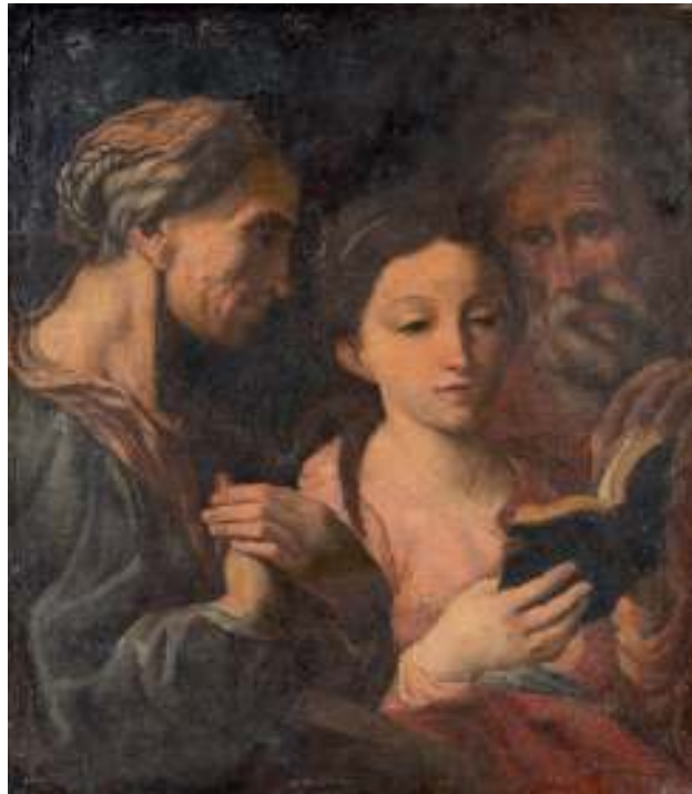
105 PITTORE ROMANO, XIX SECOLO

MADONNA CON GESÙ BENEDICENTE Olio su tela, cm. 43 x 34,5