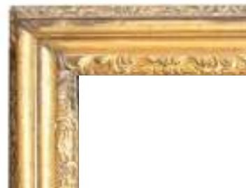
108 (dettaglio cornice)

Cornice in legno dorato con bordi a palmette e foglie, del XVIII secolo