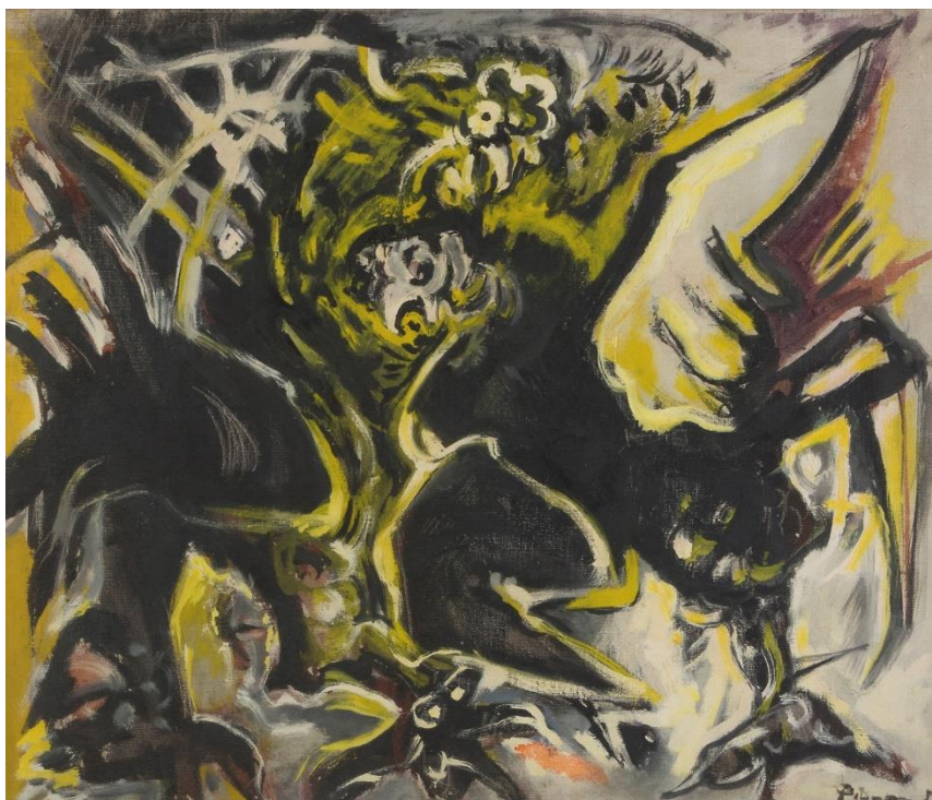
Lotto 527 - Edouard Pignon (Bully 1905 - Parigi 1993). Petit combat de coqs, 1958. Olio su tela, cm. 46 x 55.