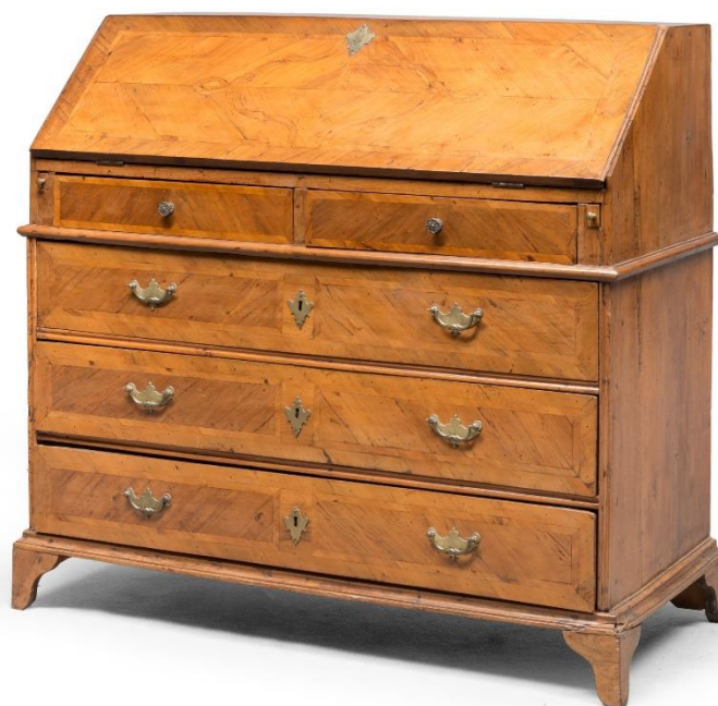
Lotto 174 - Ribalta in ciliegio con intarsi a cartigli in bois de rose. Italia centrale XVIII secolo.