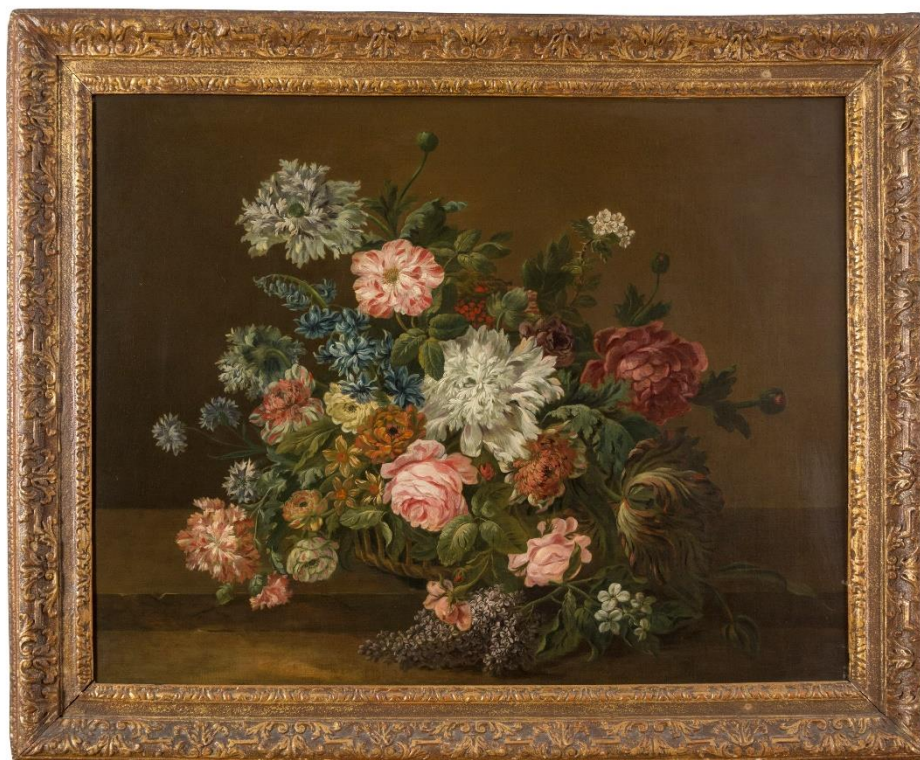
Lotto 118 - Nicolas Baudeusson, att. a (Troyes 1611 - Parigi 1680). Cesta con composizione di fiori. Olio su tela, cm. 72 x 91,5.