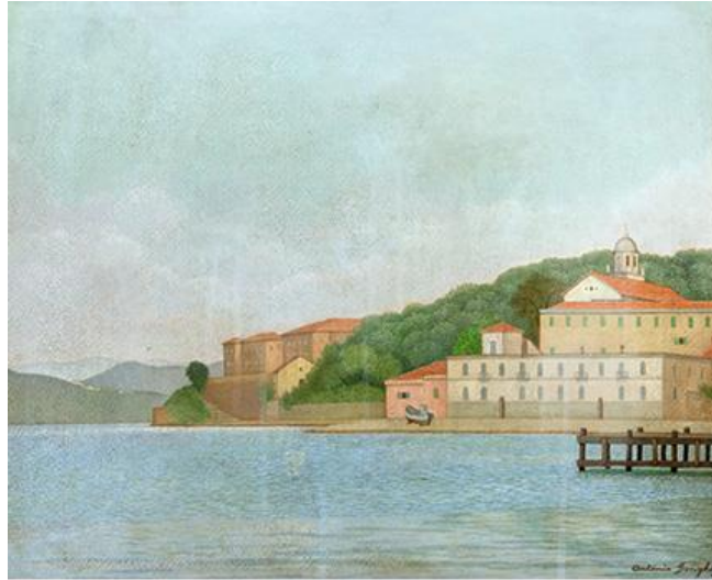
Lotto 559 - Antonio Donghi (Roma 1897 - 1963). Il golfo della Spezia, 1946. Olio su tavola, cm. 40 x 50.