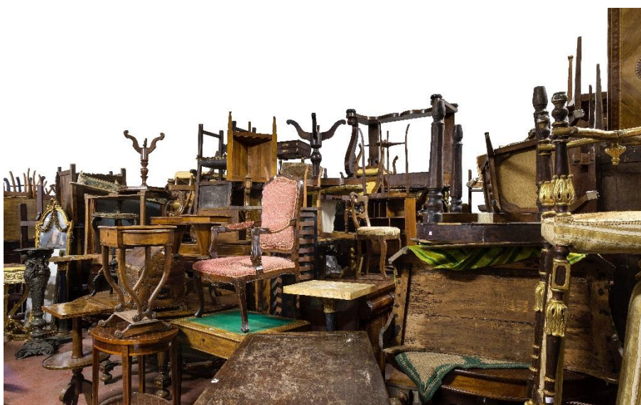
LOTTI di MOBILI – Ciclopica quantità di mobili antichi, del XIX e XX secolo al miglior offerente.