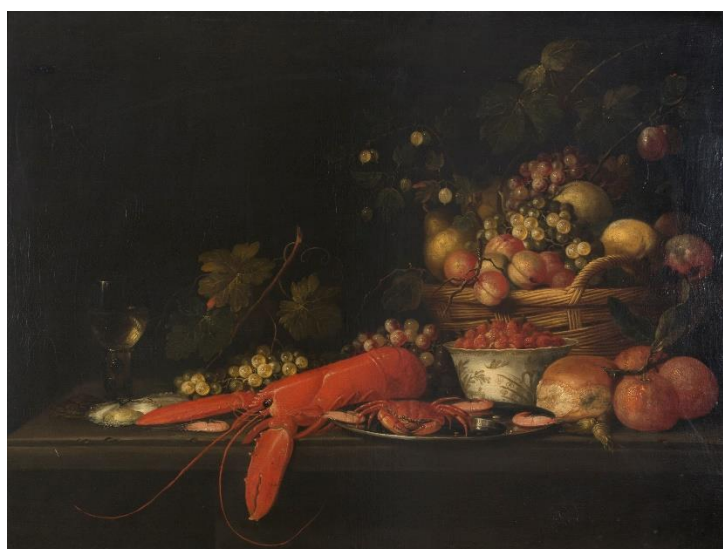
Lotto 93 - Michiel Simons, (Utrecht, meta' XVII secolo). Natura morta di frutta entro cesta di vimini, fragole di bosco, ostriche, crostacei e vettovaglie. Olio su tela, cm. 70,5 x 91.