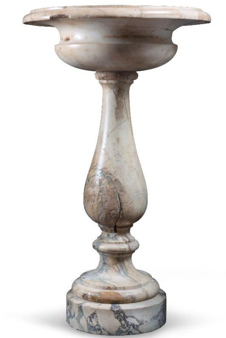
Lotto 130 - Acquasantiera in marmo bianco e marmo paonazzetto. Italia settentrionale XVII secolo. Misure cm. 83 x 63.