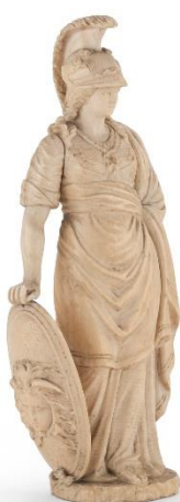
Lotto 22 - Scultura della Minerva in avorio. Fine XVIII secolo. Misure cm. 22 x 10 x 7.